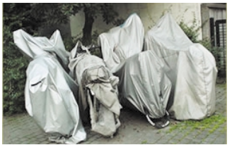
歩道はバイクの駐車場？