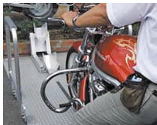
1 バイクに乗ったまま前進。

ハーレーダビッドソンのような大型バイクが2台並んでも楽に出し入れができます。 (場所・バイク提供:HDセントラルモータース川口)