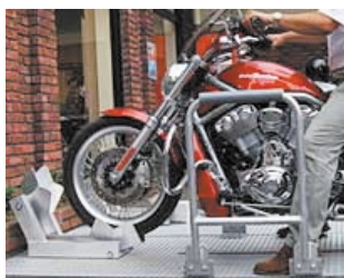
3 アクセルワークでそのまま前へ。