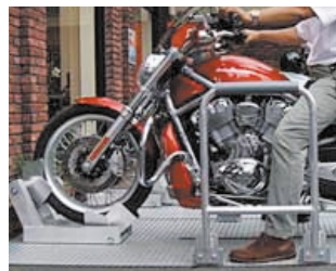
4 奥のホルダーに自動的に入ります。