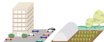
マンションやアパートの 空いた駐車場