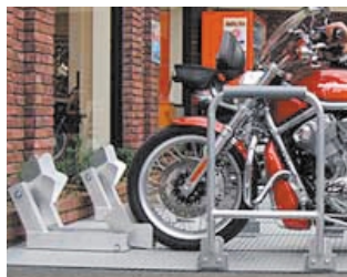
2 手前ホルダーにタイヤをあわせませす。